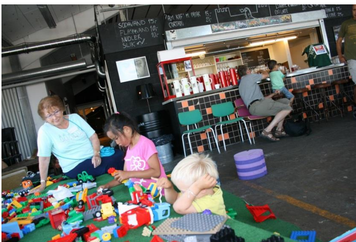
legehjørnet i cafeen